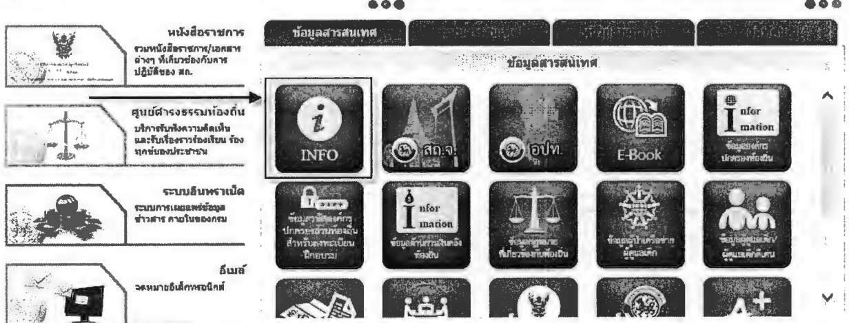
เว็บไซต์กรมส่งเสริมการปกครองส่วนท้องถิ่น

หรือเข้าผ่านทางหน้าเว็บไซต์กรมส่งเสริมการปกครองส่วนท้องถิ่น ( www.dla.go.th ) ในเมนู ข้อมูล สารสนเทศ เลือก ระบบข้อมูลกลางองค์กรปกครองส่วนท้องถิ่น (INFO)