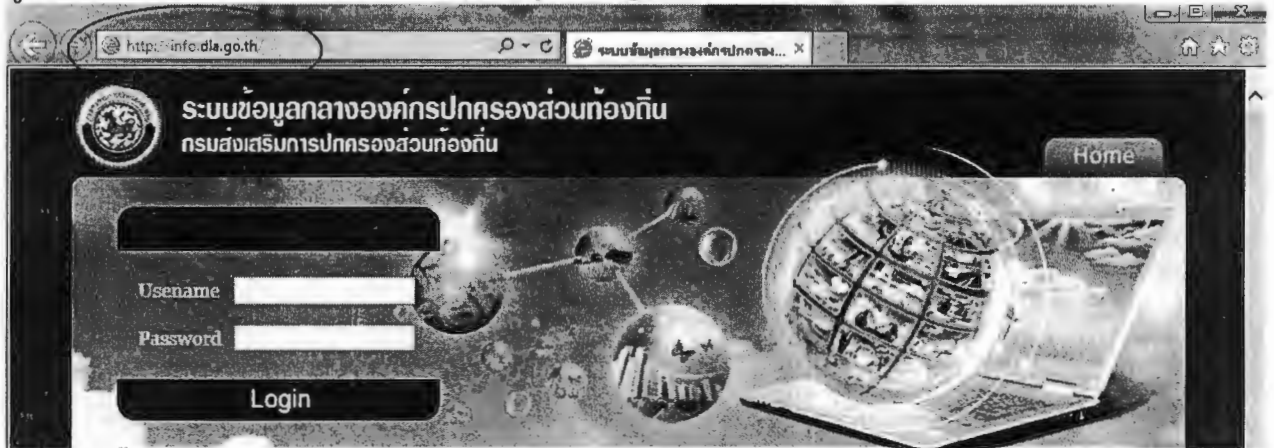
เว็บไซต์ ระบบข้อมูลกลางองค์กรปกครองส่วนท้องถิ่น

ผู้ใช้สามารถเข้าใช้ระบบได้ที่ URL : http://info.dla.go.th/