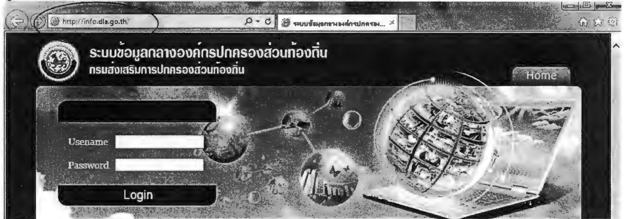
เว็บไซต์ ระบบข้อมูลกลางองค์กรปกครองส่วนท้องถิ่น

ผู้ใช้สามารถเข้าใช้ระบบได้ที่ URL : http://info.dla.go.th/