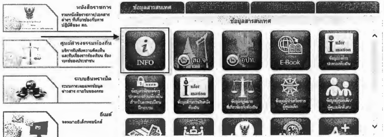
เว็บไซต์กรมส่งเสริมการปกครองส่วนท้องถิ่น

หรือเข้าผ่านทางหน้าเว็บไซต์กรมส่งเสริมการปกครองส่วนท้องถิ่น ( www.dla.go.th ) ในเมนู บริการ อปท. เลือก ระบบข้อมูลกลางองค์กรปกครองส่วนท้องถิ่น (INFO)